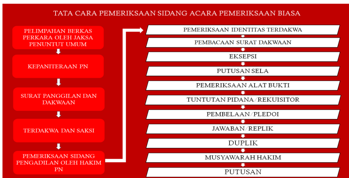
Gambar 6 : Tata Cara Pemeriksaan Sidang Pengadilan Negeri

Setelah Jaksa Penuntut Umum menerima pelimpahan Berita Acara Pelimpahan Penyidikan dan Penyerarahan Tersangka dan Alat Bukti, Jaksa selanjutnya menyiapkan dakwaan, dan dalam waktu yang singkat wajib melimpahkan dakwaan dan terdakwa ke Pengadilan Negeri untuk dilaksanakan sidang pemeriksaan perkara. Untuk itu tata cara Pemeriksaan Sidang Pengadilan dapat dilihat pada gambar berikut ini :