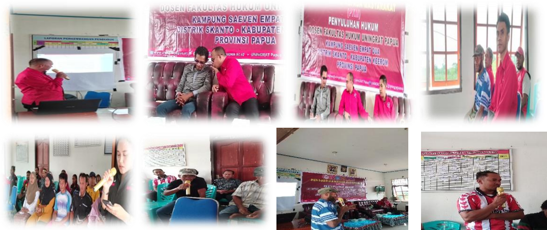
Gambar 3 : Suasana Pemaparan Materi Dan Diskusi

Pemaparan materi yang dilakukan yakni tentang sistem peradilan pidana di Indonesia, tindak pidana, proses dan tata cara penyelesaian baik dalam sistem peradilan maupun tata cara penyelesaian perkara di luar sistem peradilan pidana, dilanjutkan dengan proses diskusi dan/atau tanya jawab, sebagaimana dapat dilihat pada gambar berikut ini :