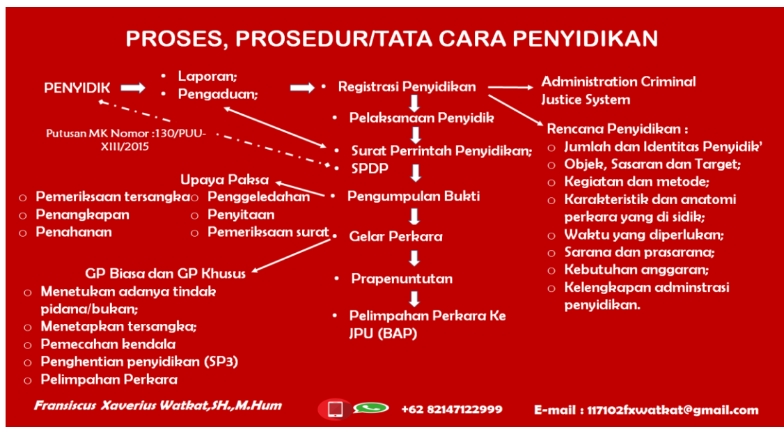
Gambar 4: Tata Cara Penyidikan

Gambar tersebut diatas, memperlihatkan kompleksitas pelaksanaan fungsi lembaga penyelidikan dan/atau penyidikan. Hal ini diperparah dengan lemahnya sistem pengaturan hukum acara pidana (KUHAP), misalnya pengaturan tentang tata cara pengeluaran Surat Perintah Di mulainya Penyidikan (SPDP), tata cara Penghentian Penyidikan (SP3), pelaksanaan Gelar Perkara dan tata cara Pra Penuntutan. Hal-hal tersebut yang sama sekali tidak diatur dalam KUHAP. Penting untuk diketahui bahwa dalam lembaga penyelidikan dan/atau penyidikan adalah merupakan pintu gerbang dalam sistem peradilan pidana ( the gate keeper ) oleh karena itu, baik buruknya penilaian masyarakat terhadap proses peradilan pidana sangat bergantung oleh lembaga ini.