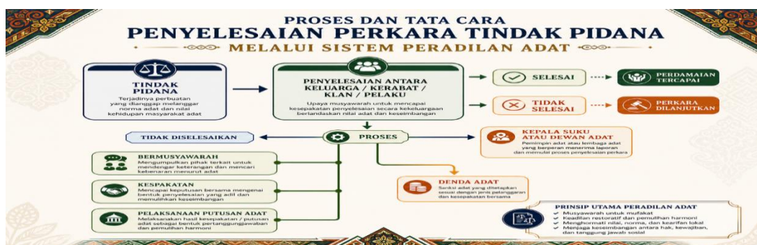
Gambar 7: Tata Cara Penyelesaian Perkara Menurut Sistem Peradilan Adat

Sebagai contoh ilustrasi tata cara atau proses penyelesaian perkara melalui sistem peradilan adat dapat dilihat pada gambar berikut ini :