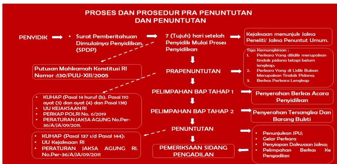
Gambar 5 : Tata Cara Penuntutan

Selanjutnya, tata cara penuntutan pada tahapan penuntutan oleh Jaksa Penuntut Umum, dapat dilihat pada gambar tentang alur proses dan prosedur penuntutan berikut ini :